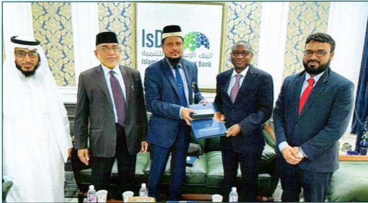
لقاء وفد الجامعة مع معالي الدكتور منصور مهاتر، نائب الرئيس، البنك الإسلامي للتنمية