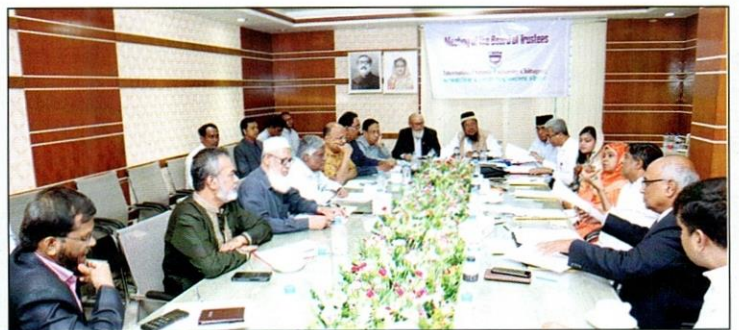
Recent meeting of the Board of Trustees, International Islamic University Chittagong