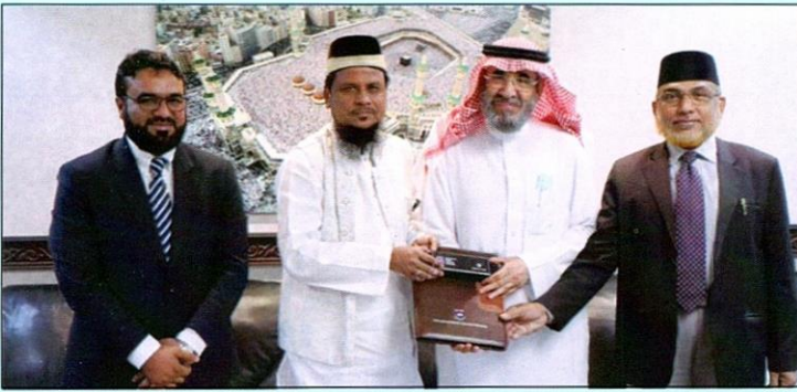
لقاء وفد الجامعة مع معالي الدكتور صالح بن سليمان الوهبي الأمين العام للندوة العالمية للشباب الإسلامي