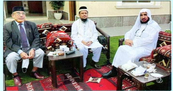
لقاء وفد الجامعة مع معالي الأستاذ الدكتور/ إبراهيم أبو عباة عضو مجلس الشورى سابقا بالمملكة العربية السعودية