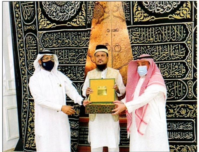
Visiting Qaaba Gilaf Industry invited by Sheikh Dr. Abdur Rahman As-Sudais, Hon'ble Imam Masjidul Haram, Makkah.