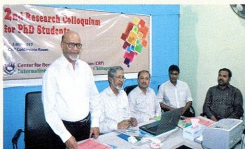
يقدم سعادة مدير الجامعة البروفيسور محمد أنوار العظيم عارف التوجيهات الهامة للباحثين بالجامعة.