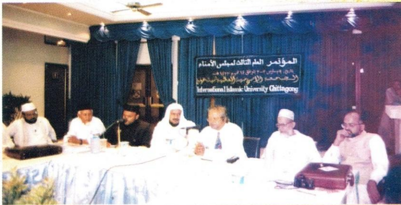
معالي البروفيسور محمد علي مدير الجامعة السابق يترأس في إحدى جلسات الاجتماع العام الثالث لأمانة الجامعة.