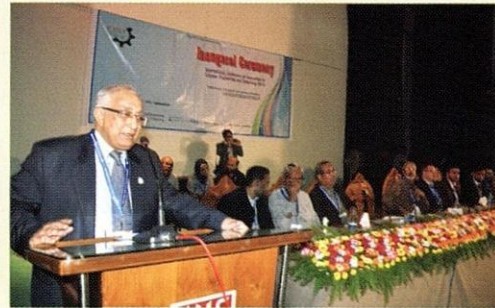
سعادة الدكتور جميل الرضاء تشودھري المستشار السابق للحكومة الانتقالية يلقي كلمته كضيف أول في المؤتمر العالمي بالجامعة الإسلامية العالمية شيتاغونغ.