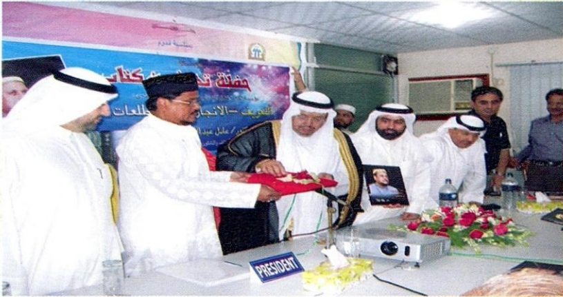
معالي الدكتور عادل الفلاح يقوم بتدشين الكتاب في مقر مؤسسة العلامة فضل الله شيتاغونغ، بنغلاديش بحضور وفد الكويت رفيع المستوى.