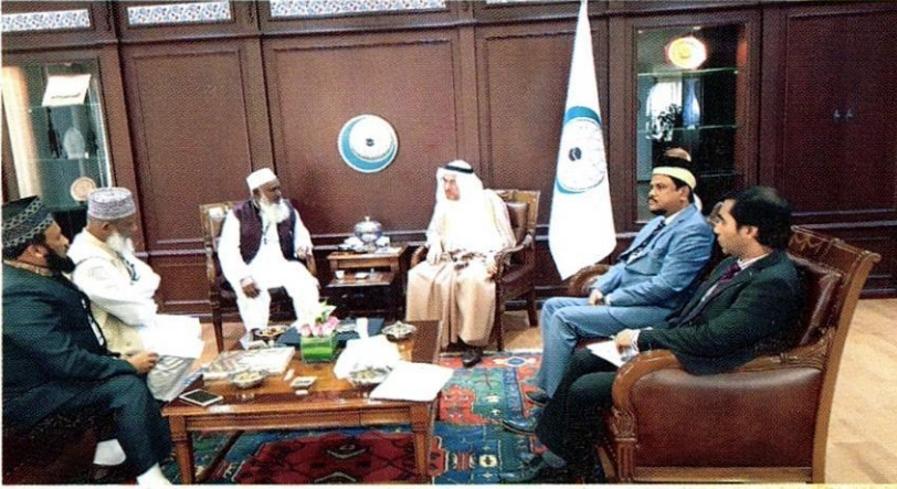
اجتماع الدكتور أبو الرضاء الندوي مع الأمين العام السابق لمنظمة التعاون الإسلامي.