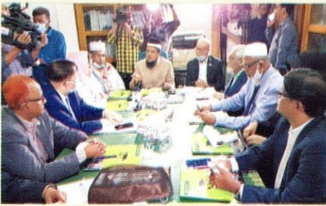
أول اجتماع مجلس الأمناء الجديد المعتمد لدى الحكومة للجامعة الإسلامية العالمية شيتاغونغ برئاسة البروفيسور الدكتور أبو الرضاء الندوي.