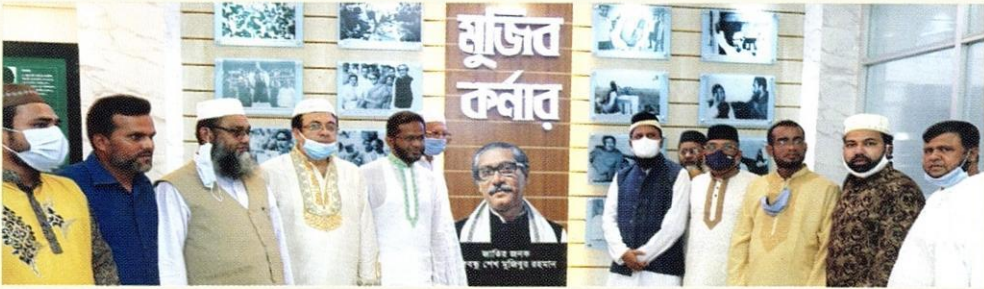
معالي البروفيسور الدكتور أبو الرضاء الندوي والضيوف الآخرون أثناء افتتاح جناح الشيخ مجيب الرحمن بالجامعة.