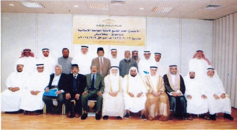
المشاركون في الاجتماع العام التاسع لأمانة الجامعة المنعقد بجدة بالمملكة العربية السعودية.