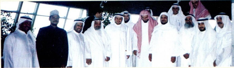
الدكتور أبو الرضاء الندوي مع الدكتور عادل الفلاح وعدد من كبار المسؤولين لدولة الكويت في دولة الكويت الشقيقة.