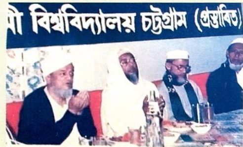
أبرز أعضاء المجلس التأسيسي للجامعة أثناء أحد الاجتماعات التمهيدية.