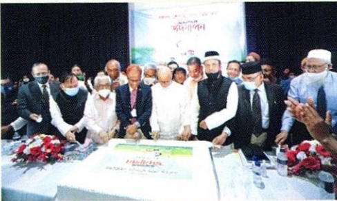
أعضاء مجلس الأمناء بالجامعة برئاسة البروفيسور الدكتور أبو الرضاء الندوي خلال افتتاح مهرجان المئوي لميلاد الشيخ مجيب الرحمن.