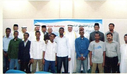
الطلاب الوافدون من مختلف الدول في صورة جماعية مع الضيوف الكرام.