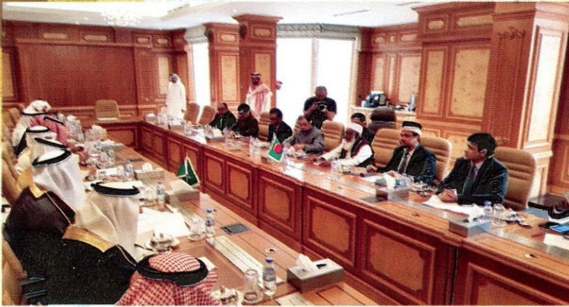
حضور الدكتور أبو الرضاء الندوي في الاجتماع الثنائي بين بنغلاديش والمملكة العربية السعودية بحضور الوزراء والكلاء في شئون الحج والعمرة.