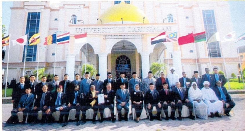
فضيلة الأستاذ الدكتور قاضي دين محمد، نائب رئيس مجلس أمناء الجامعة مع وزيرة الخارجية الاندونيسية، وروساء ومدراء جامعات اتحاد الافرو آسيوية أثناء الملتقى باندونيسية.