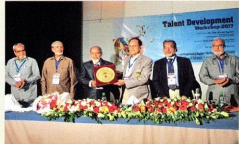
يقدم مدير الجامعة السابق درع الجامعة إلى سعادة الأستاذ عبد الكريم، الوكيل الرئيسي لحكومة بنغلاديش.