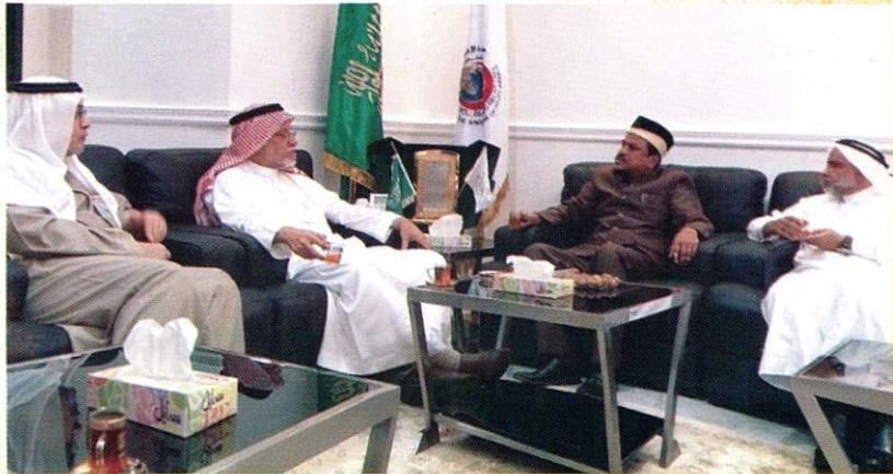
اجتماع مع كبار المسؤولين مع الهيئة العالمية للإغاثة والرعاية والتنمية في جدة.