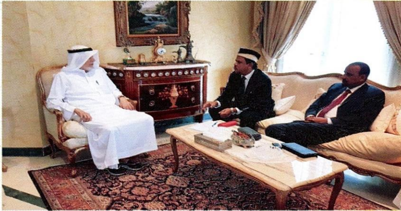
اجتماع مع معالي الدكتور عبد الله عمر نصيف في منزله بجدة.