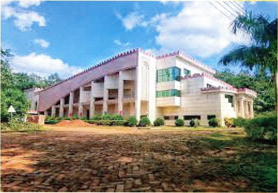
قاعة المحاضرات و المدرج الكبرى