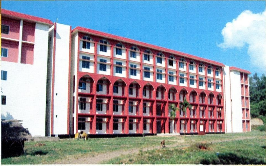
مبنى كلية الدراسات التجارية