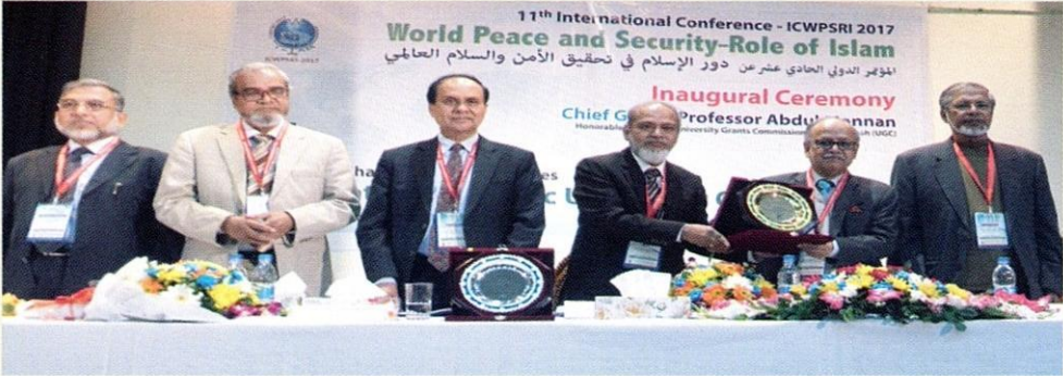
سعادة مدير الجامعة الإسلامية شيتاغونغ السابق يقدم الدرع إلى رئيس لجنة موافقة الجامعات سعادة البروفيسور محمد عبد المنان.

ويجدر بالذكر أن الدراسة بالجامعة تكون في مقرين منفصلين للبنين والبنات، وهذه هي الجامعة الوحيدة في البلاد التي تتبع نظام الانفصال في تدريس الطلاب والطالبات.