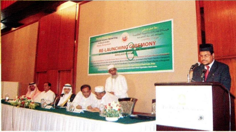
الدكتور أبو الرضاء الندوي يلقي الكلمة في حفلة فتح الهيئة العالمية للإغاثة والرعاية والتنمية من جديد في داكا، بنغلاديش بحضور الوزراء والوكلاء والسفراء.