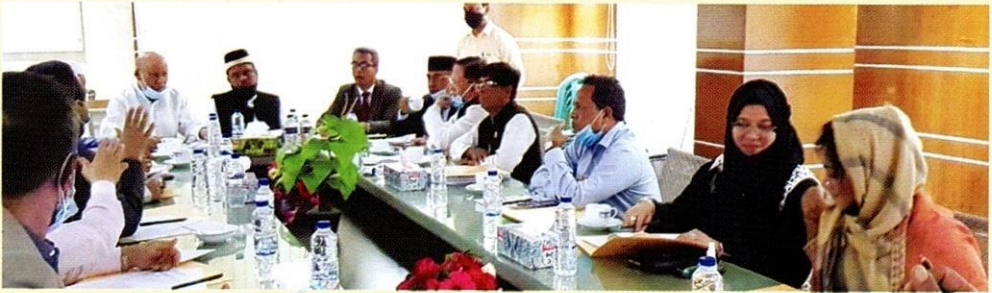
أعضاء مجلس أمناء الجامعة أثناء اجتماعهم بالجامعة.