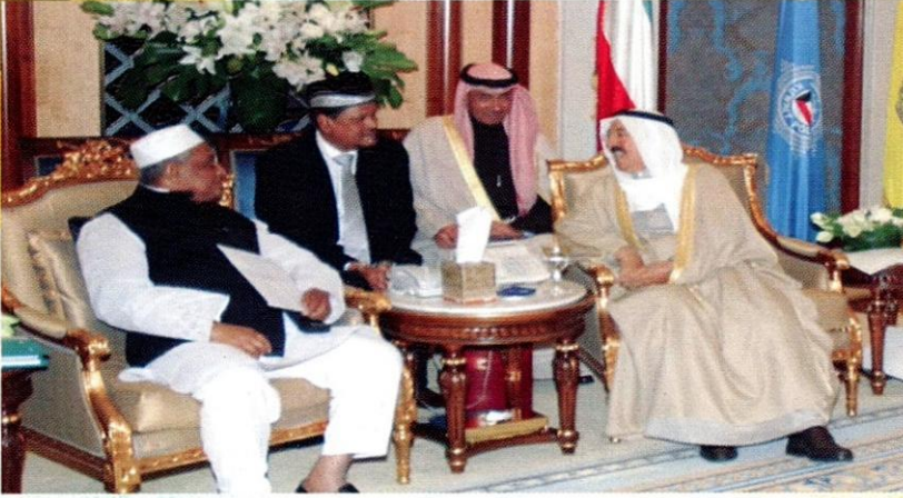
اجتماع الدكتور أبو الرضاء الندوي، رئيس مجلس الأمناء بالجامعة، وعضو البرلمان الوطني لبنغلاديش مع صاحب السمو أمير دولة الكويت بحضور الوزراء والوكلاء من البلدين الشقيقين.