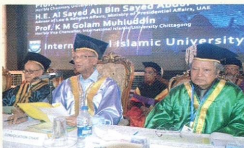
معالي السيد نور الإسلام ناهيد، وزير التعليم السابق لبنغلاديش يترأس في حفلة التخرج الرابعة بالجامعة.