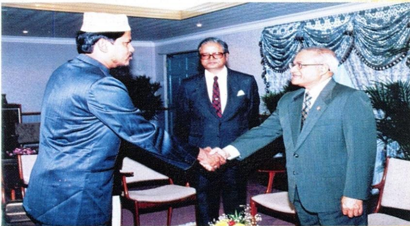
يستقبل فخامة الرئيس السابق مامون عبد القيوم وفد الجامعة، وحضر فيه الدكتور أبو الرضاء الندوي.