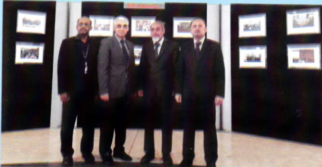
التقى معالي مدير الجامعة الإسلامية العالمية شيتاغونغ ومدير مركز البحوث بالجامعة مع معالي نائب رئيس الجامعة الإسلامية العالمية بماليزيا في مكتب معاليه بماليزيا

وتم في الاجتماع تبادل الآراء والتباحث حول التعاون الثنائي بين الجامعتين. كما وافق الوفد المجري على إعطاء الفرصة لطلاب الجامعة الإسلامية العالمية شيتاغونغ من مختلف الأقسام لمواصلة الدراسة في جامعة لوراند يوتباف بالمجر برسوم مخفضة بنسبة % ٥٠ في المائة. هذا وقد وافق الطرفان على أنه سوف يتم إبرام اتفاقية التفاهم بين الطرفين لتبادل الآراء والخبرات والطلاب والأساتذة بينهما في تخصصات مختلفة.