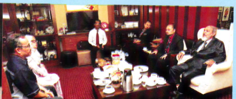
اجتماع معالي مدير الجامعة الإسلامية العالمية شيتاغونغ مع كبار مسؤولي جامعة العلوم الإسلامية بماليزيا