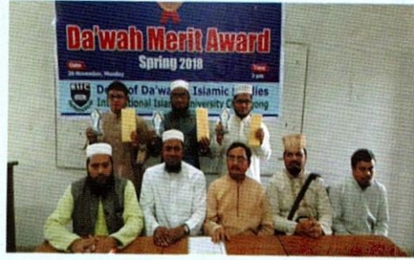
দাওয়াহ মেরিট অ্যাওয়ার্ড গ্রাপ্ত শিক্ষার্থীরা

দা'ওয়াহ অ্যান্ড ইসলামিক স্টাডিজ বিভাগ মেধাবীদের লালন কেন্দ্র। প্রতিভাধরদের মূল্যায়ন করতে সদা তৎপর এ বিভাগ। কেননা যে দেশে গুণীদের মূল্যায়ন নেই সে দেশে গুণী জন্মায় না। আন্তর্জাতিক ইসলামী বিশ্ববিদ্যালয় চট্টগ্রামে মেরিট অ্যাওয়ার্ড প্রোগ্রাম শুধু দা'ওয়াহ বিভাগই চালু করেছে। প্রত্যেক সেমিস্টারে ৬ জন ছাত্র-ছাত্রী এই অ্যাওয়ার্ড পেয়ে থাকেন। ছাত্রদের মধ্যে রেজাল্টের ভিত্তিতে সেরা ৩ জন এবং ছাত্রীদের মধ্যে ৩ জন সেরা রেজাল্টধারীকে এই অ্যাওয়ার্ড প্রদান করা হয়। অ্যাওয়ার্ড হিসেবে তাদেরকে ফ্রেস্ট, নগদ অর্থ ও সার্টিফিকেট প্রদান করা হয়।