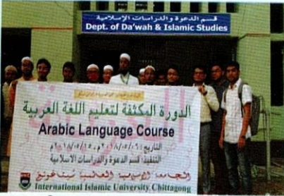
দাওয়াহ বিভাগের উদ্যোগে আয়োজিত ফ্রি আরবি ভাষা শিক্ষা কোর্সের শিক্ষার্থীদের একাংশ।

সৌদি আরবে পড়াশোনা করতে ইচ্ছুকদের অ্যারাবিক দক্ষতার ওপর সার্টিফিকেট থাকলে সেখানকার বিশ্ববিদ্যালয়ে চান্স পাবার সম্ভাবনা অনেকাংশে বেড়ে যায়। বিশেষত কিং আব্দুল আজিজ বিশ্ববিদ্যালয়ে আরবি সাহিত্য কিংবা ইসলামিক স্টাডিজ আবেদন করতে হলে আরবি কোর্স সার্টিফিকেট সাবমিট করতে হয়।