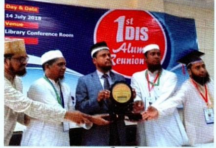
প্রফেসর ড. আবু রেজা নদভী এম.পি কে DIS Alumni Association এর পক্ষ থেকে সম্মাননা ট্রেস্ট প্রদান

দা'ওয়াহ বিভাগ থেকে পাশ করে শিক্ষার্থীরা যেন বিভাগের সাথে সম্পর্কহীন না হয়ে যান এজন্য গঠন করা হয়েছে দা'ওয়াহ অ্যালামনি অ্যাসোসিয়েশন। গত ১৪ জুলাই ২০১৮ ইং বিভাগের উদ্যোগে অনুষ্ঠিত হয় প্রথম অ্যালামনি অ্যাসোসিয়েশনের প্রথম রিইউনিয়ন।